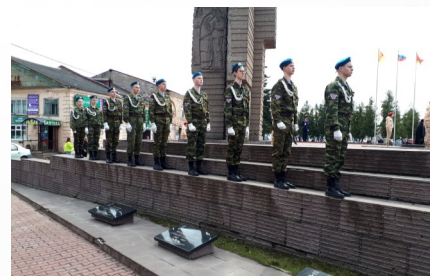
2019 Почетный караул у Обелиска