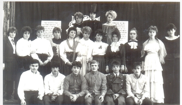
Театральная постановка, посвященная декабристам, 1987 г