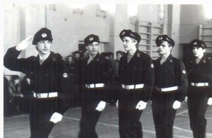
1987 г, Смотр строя и песни