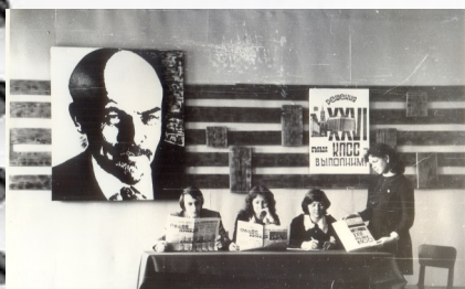
1981 г. Комсомольцы изучают материалы XXVI съезда КПСС