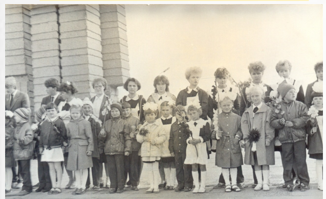
1 сентября 1987 год 1 и 10 классы Традиционная линейка у Обелиска