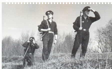
1987 г Военно-спортивная игра «Зарница»