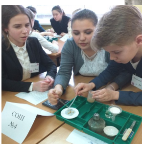
Команда химиков 8 класса— победителей муниципальной игры в 2020 г