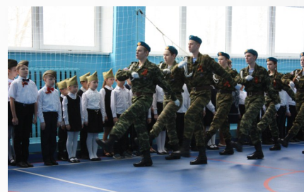
2020 г, Смотр строя и песни