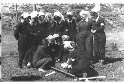
1969г., годы Занятия в дружине скорой помощи