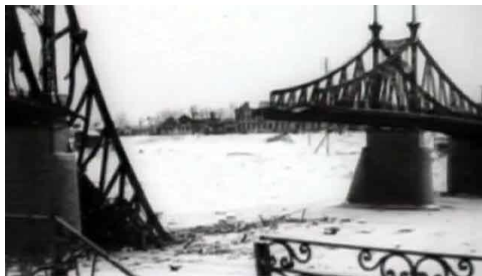
На фото: разрушенный старый мост через Волгу в Калининне

Жители области внесли большой вклад в ние победы над врагом. Они поставляли фронту бомбы и снаряды, мины и минометы, санитарные вагоны, солдатские сапоги и валенки, белье, ремонтировали боевую технику, выращивали хлеб и овощи, заготов-