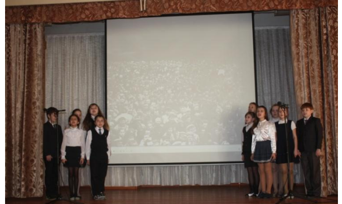
На фото: выступление 5а класса