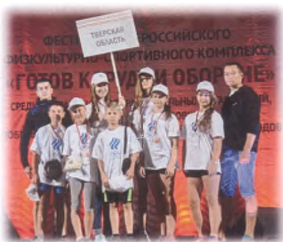
Сборная Тверской области