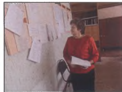
«Что день грядущий нам готовит...»

Мы поздравляем вас с Днем учителя и желаем счастья, терпения и здоровья!