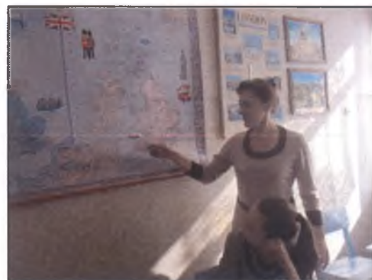
«На каникулы мы поедим сюда...»