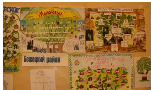
Работы участников конкурса Бежецкого района

На базе МОУ СОШ №4 состоялся зональный этап конкурса «История твоей семьи в истории Тверской земли». Участники конкурса восьми близлежащих районов приехали на встречу с представителями Министерства образования Тверской области.