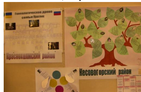
Работы Краснохолмского и Кесовогорского районов